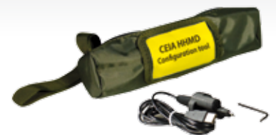
携帯型金属探知器設定ツール