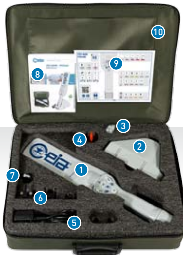
キャリアバッグに入ったPD240セット