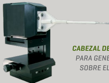
CABEZAL DE CALENTAMIENTO HH10/HH11 PARA GENERADORES 32/45/64, MONTADO SOBRE EL POSICIONADOR ES35